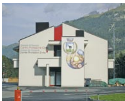
Il nuovo Centro di Protezione Civile di Canazei

Non sono certo mancati gli obiettivi concreti portati a termine in questi 5 anni per la valle di Fassa dal governo provinciale. Le richieste presentate in materia di viabilità e infrastrutture sono state recepite, effettuando in questa direzione importanti investimenti che hanno consentito il proseguimento delle grandi opere strategiche per il futuro della valle di Fassa e della sua economia turistica.