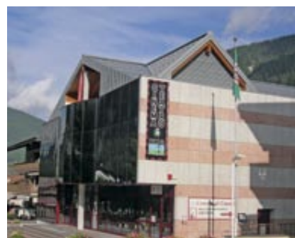
Cinema di Canazei ristrutturato