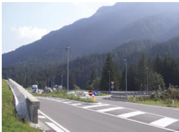
Rotatoria di Soraga

Non sono certo mancati gli obiettivi concreti portati a termine in questi 5 anni per la valle di Fassa dal governo provinciale. Le richieste presentate in materia di viabilità e infrastrutture sono state recepite, effettuando in questa direzione importanti investimenti che hanno consentito il proseguimento delle grandi opere strategiche per il futuro della valle di Fassa e della sua economia turistica.