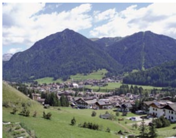
Panoramica di Pozza di Fassa

Per restare in tema di territorio, il problema di un livello di edificazione che ha ormai saturato il territorio di Fassa era stato posto dalla UAL tra le indicazioni per l'accordo elettorale di inizio legislatura, che manifestava l'esigenza di soluzioni coraggiose. La nuova legge in materia di urbanistica approvata dal governo provinciale l'11 novembre 2005 (la cosiddetta Legge sulle seconde case ) ha risposto alle sollecitazioni in questo senso ed è stata sostenuta con forza dalla UAL.