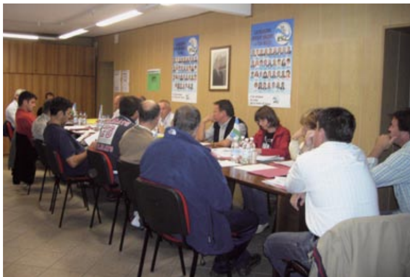
Una delle Commissioni della UAL al lavoro

Le suddette Commissioni hanno tra l'altro elaborato l'articolo 19 della Riforma istituzionale che prevede l'istituzione del Comun General de Fascia ; il titolo speciale sulla Scuola di Fassa nella legge di Riforma del sistema di educazione e formazione; i contributi e le osservazioni sulla Legge della Cultura e sul Piano Urbanistico Provinciale , dove è stato anche proposto un parco naturalistico nell'area del Catinaccio per valorizzare il patrimonio naturalistico di Fassa.