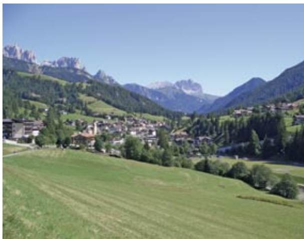
Panoramica di Soraga